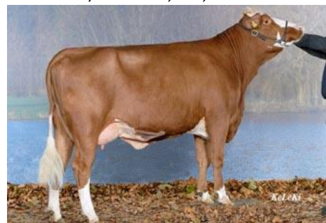
Anita AT 610.016.172 5/4 9.548-3,92-3,54-712