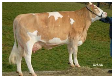
Betty AT 645.693.607 6/5 10.328-4,43-3,53-823