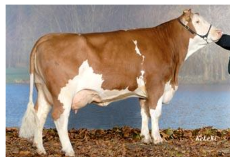
Elis AT 226.655.107 4/3 6.223-5,20-3,76-558