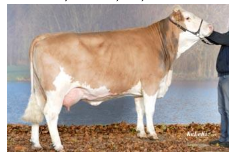
Mori AT 833.052.872 1/1 7.360-4,84-3,58-619