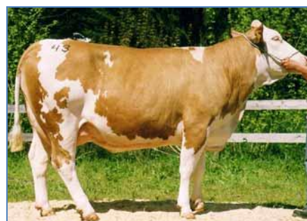
Gilde AT 866.661.934 8/7 7.600-4,03-3,44-568