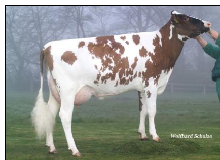
Pandora 03 49439832